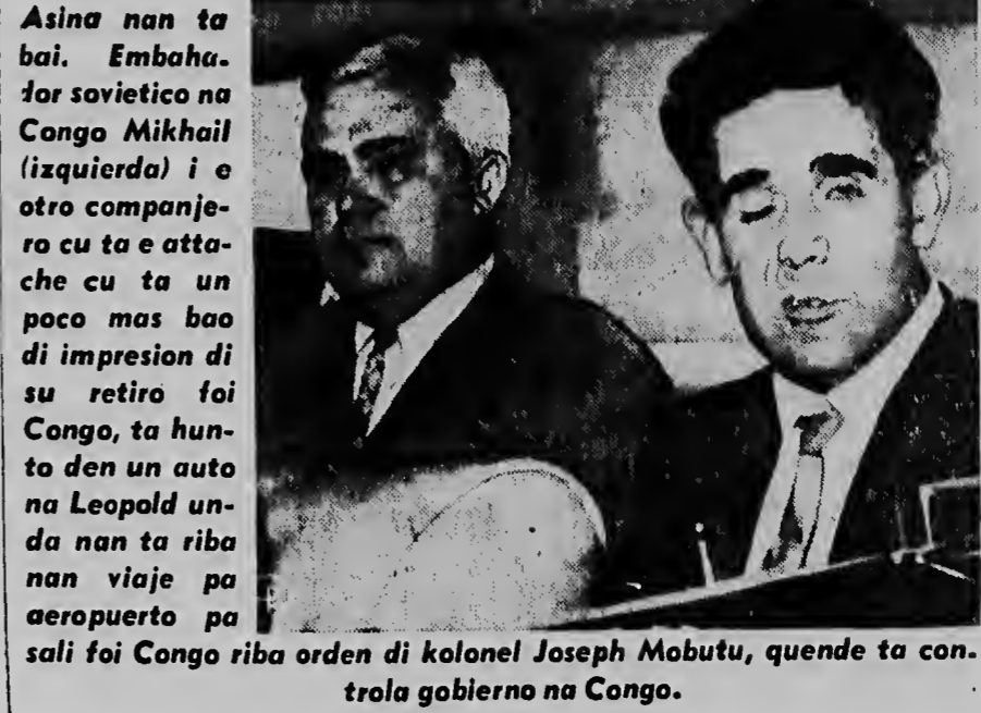
Asina nan ta bai. Embahador sovietico na Congo Mikhail (izquierda) i e otro companje-ro cu ta e atache cu ta un poco mas baa di impresion di su retiro foi Congo, ta hunto den un auto na Leopold unda nan ta riba nan viaje pa aeropuerto pa sali foi Congo riba orden di kolonel Joseph Mobutu, quende ta controla gobierno na Congo.